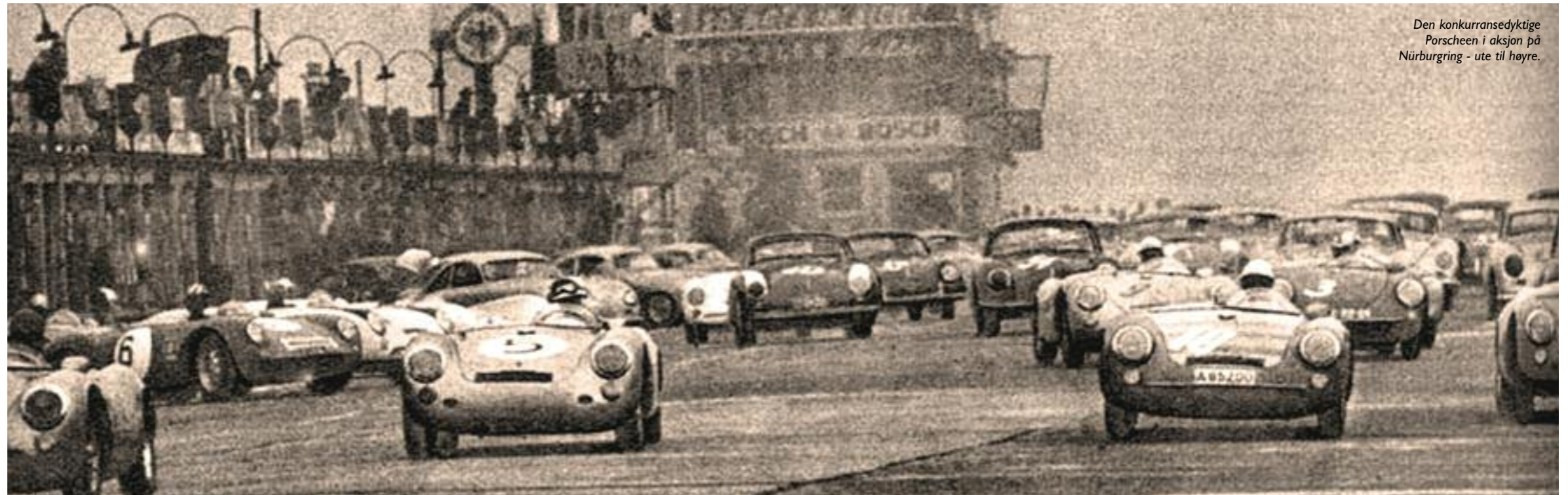
Den konkurransedyktige Porscheen i aksjon på Nürburgring - ute til høyre.

Kaiser behøvde ikke betale bilen før han solgte den igjen. Den blå-gule raceren var nemlig tenkt som et ledd i Porsches markedsføring, og den havnet også direkte i nyhetsmediene da Kaiser satte ny svensk